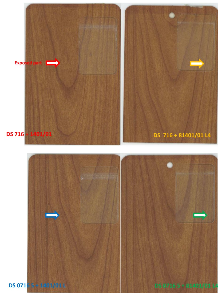
Figura 2: campioni testati all'invecchiamento accelerato per 1000 ore (PV Standard) e per 2500 ore (PV classe2)