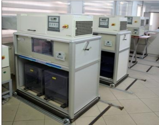
Figura 1: apparecchiature per l'invecchiamento accelerato

Per valutare la resistenza delle finiture nei laboratori vengono prevalentemente utilizzati test di invecchiamento accelerato; si tratta di test controllati e ripetibili che ricreano e simulano fedelmente alcuni dei fattori delle esposizioni naturali.