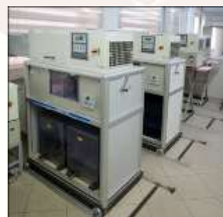
Macchine per l'invecchiamento accelerato Decoral Lab

Il QualityDecoral Gold esige anche l'esposizione in Florida, dove le condizioni ambientali e atmosferiche sono più aggressive che altrove, per un periodo di tre anni.