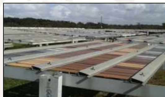
Lamierini in esposizione Florida